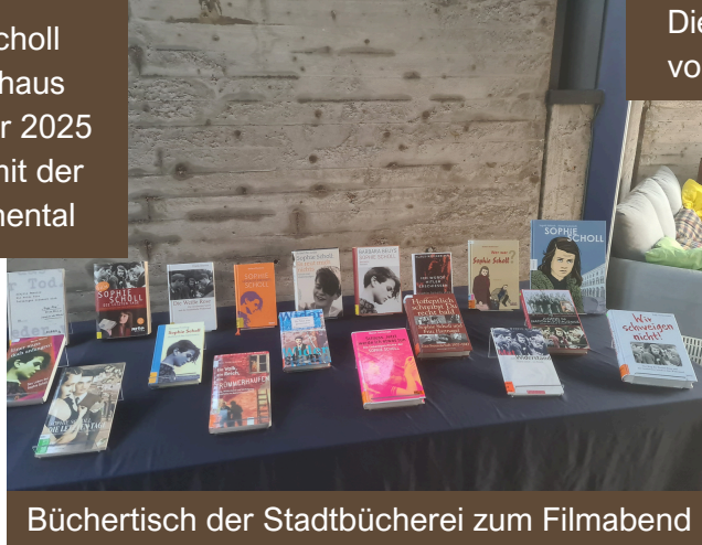
Büchertisch der Stadtbücherei zum Filmabend