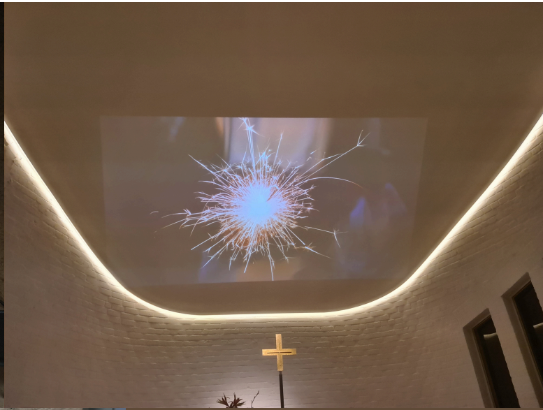
Die Präsentation via Beamer an Silvester vorne in der Apsis der St. Martins-Kirche