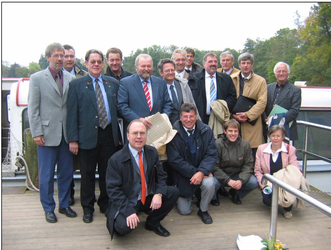
Der Vorstand nach seiner Wahl am 11. Oktober 2007