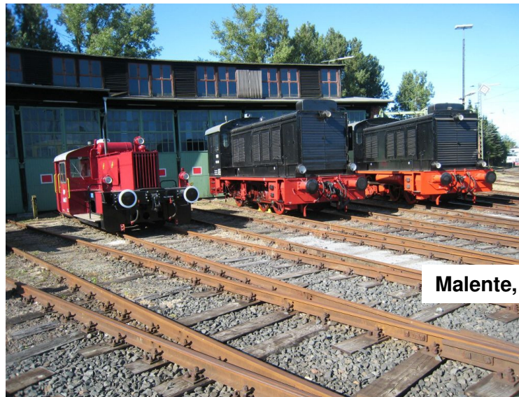
Malente, Bhf. Holst. Schweiz